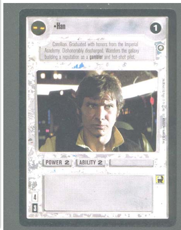
Han with Heavy Blaster Pistol ( Han avec le pistolet blaster lourd )